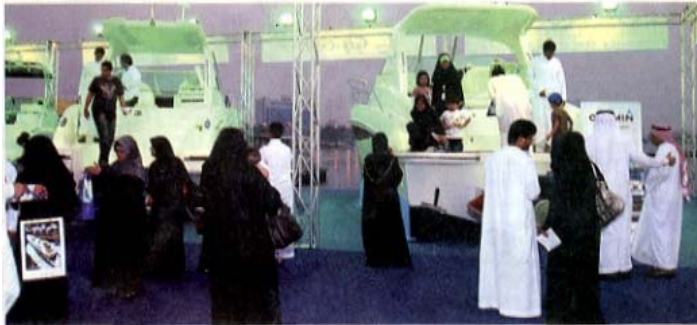
جانب من المعرض السعودي الأول للقوارب

الأوروبية. يشار إلى أن جدة احتضنت بدءاً من يوم الأربعاء المنصرم وحتى عشية أول من أمس السبت معرض القوارب السعودي الأول، برعاية من أمير منطقة مكة المكرمة، الأمير خالد الفيصل، وحضور الأمير سلطان بن سلمان، رئيس الهيئة العامة للسياحة والآثار في السعودية، وتكلم من الهيئة العامة للسياحة ومجموعة الأعلام السياحية، ومركز دبي التجاري العالمي