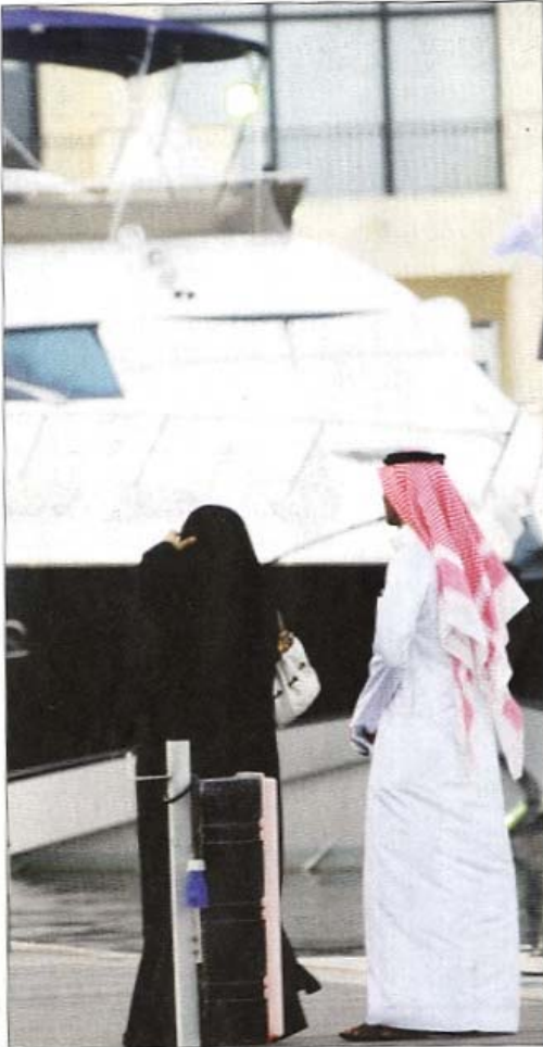
سيدة ومواطن يقفان أمام قارب سياحي في المعرض السعودي الدولي للقوارب في جدة.