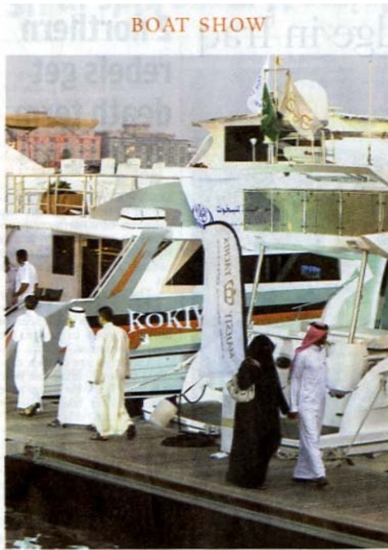
A couple walk along the boats and yachts during an exhibition sponsored by the Dubai World Trade Center in Jeddah, Friday.